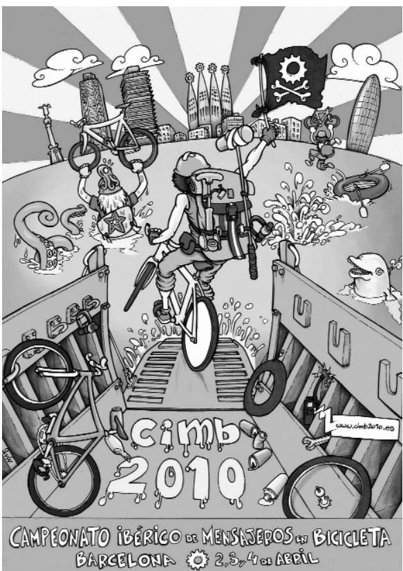
CAMPEONATO IBÉRICO DE MENSAJEROS EN BICICLETA BARCELONA 2, 3, 4 de ABRIL